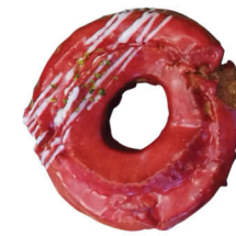
木苺オールドファッションくるみ