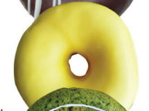
焼きレモンリング