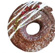
チョコファッションくるみ