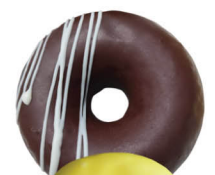
焼きチョコリング