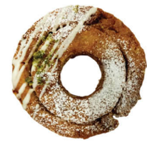
オールドファッションくるみ

生地におからと豆乳を練り込み、オールドファッション系はカリカリ 焼きドーナツ系はしっとりとした食感、原材料にもこだわり、 無添加自然卵『おのたま』を使いコクと風味のある生地にて仕上げました。