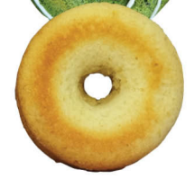
焼きジェノワリング